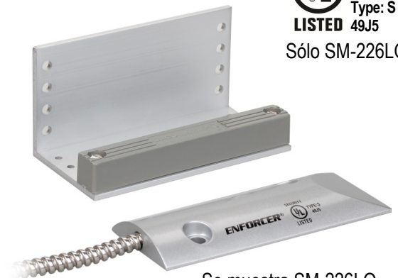
Se muestra SM-226LQ