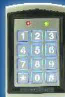
Serie de SK-1323 Teclado numérico autónomo de carcasa sellado Con ó sin lector de proximidad