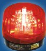
Serie de SL-1301 Luces Estroboscópicas LED Programables 5 Colores diferentes disponibles