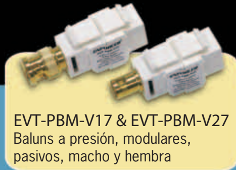
EVT-PBM-V17 & EVT-PBM-V27 Baluns a presión, modulares, pasivos, macho y hembra