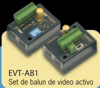
EVT-AB1 Set de balun de video activo

El balun de video pasivo EVT-PB1-V1TSQ de SECO-LARM es la forma más rápida, fácil y económica de conectar una cámara de CCTV a un monitor, multiplexor o grabador de video. El balun de video permite transmitir la señal de video de una única cámara de CCTV a grandes distancias sobre un cable de par trenzado no blindado (UTP) cat5, económico. Para facilitar la instalación y uso, el modelo EVT-PB1-V1TSQ es compacto e incorpora terminales de tornillo y una protección contra sobretensiones integrada.