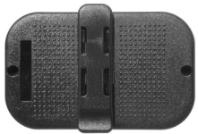
Broche para el Cinturón (incluido).