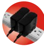
Se adapta fácilmente a barras de alimentación