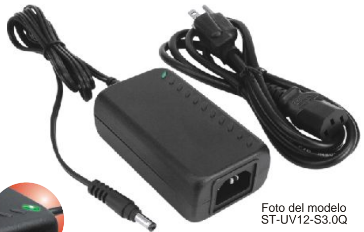
Foto del modelo ST-UV12-S3.0Q